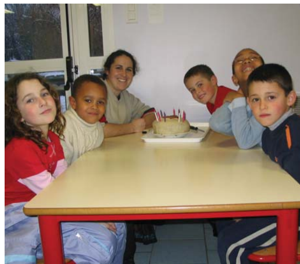
La garderie périscolaire accueille en moyenne 28 enfants le matin et une douzaine le soir.

Nous rappelons que les inscriptions sont prises directement à la garderie (local de la cantine parentale) et qu'en cas d'imprévu il est toujours possible au dernier moment de trouver une solution en s'adressant directement au personnel de la garderie. Par ailleurs, il est à noter qu'un goûter est fourni aux enfants l'après-midi (inclus dans la somme forfaitaire de 1.50€).