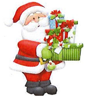
Photo avec le Père Noël

Chocolat chaud offert par le Comité des Fêtes