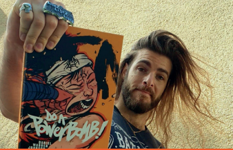
Le Commis des Comics